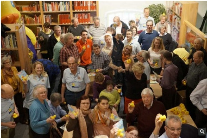
Gut 40 Mitglieder aus den Lions Clubs Norderstedt, Norderstedt-Forst Rantzau und Norderstedt NEO kamen am Sonntagmorgen ins Feuerwehrmuseum Schleswig-Holstein, um 2.500 gelutschgelbe Gummi-Enten für den Benefiz-Verkauf vorzubereiten. Am 31. Mai 2015 sollen alle bis dahin verkauften Rennenten auf dem Norderstedter Startparksee an den Start gehen.